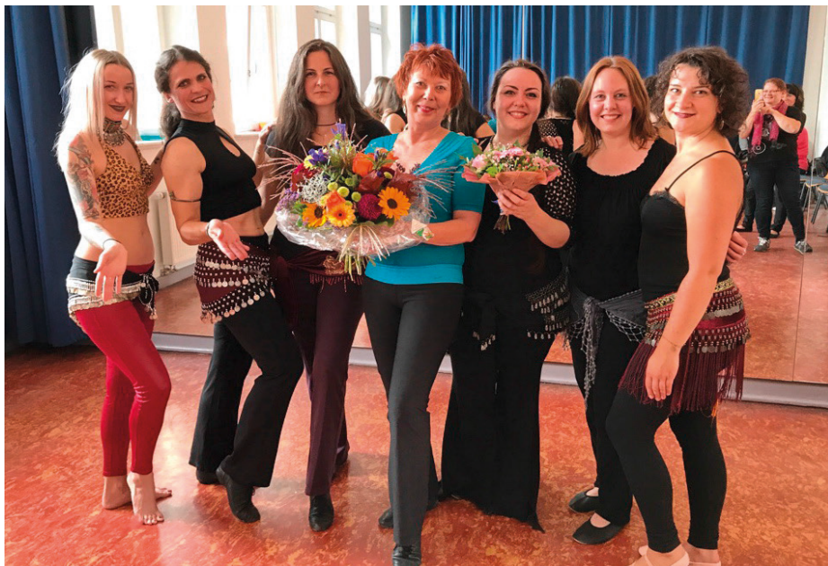
Foto: Werkschau 20-jähriges Jubiläum – Saida mit Frauen der Tanzgruppe Fortgeschrittene

Individuelle tänzerische Förderung durch Kleingruppenunterricht! Erlernbar für jede Frau und geeignet für alle Altersgruppen ab 13 Jahren! Ideal auch für Frauen von 50 bis 99 Jahren!